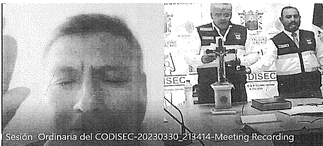
Sesión Ordinaria del CODISEC-20230330_213414-Meeting Recording